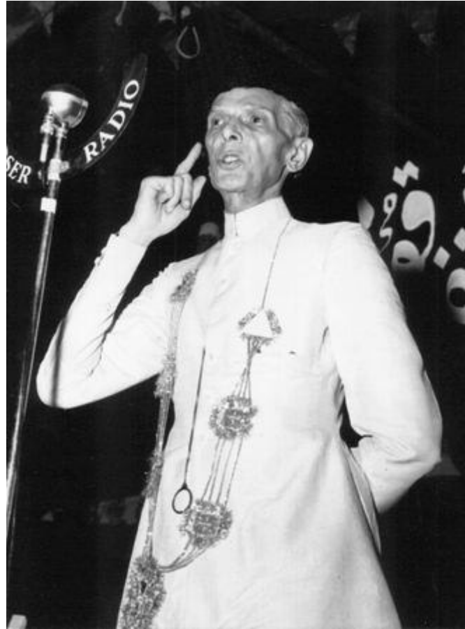
Mohammad Ali Jinnah (1887-1948)