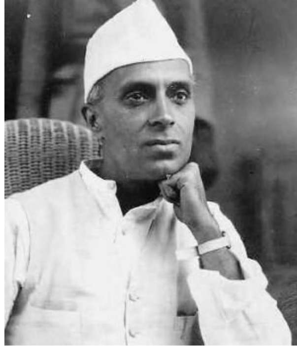
Jawaharlal Nehru (1889-1964)