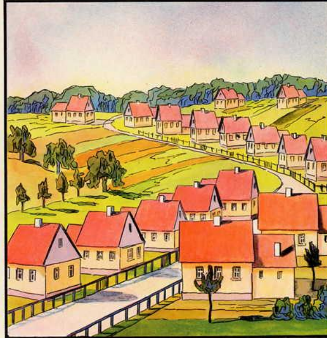
17 Eigenheime für erbgefunde Arbeiterfamilien erstellen