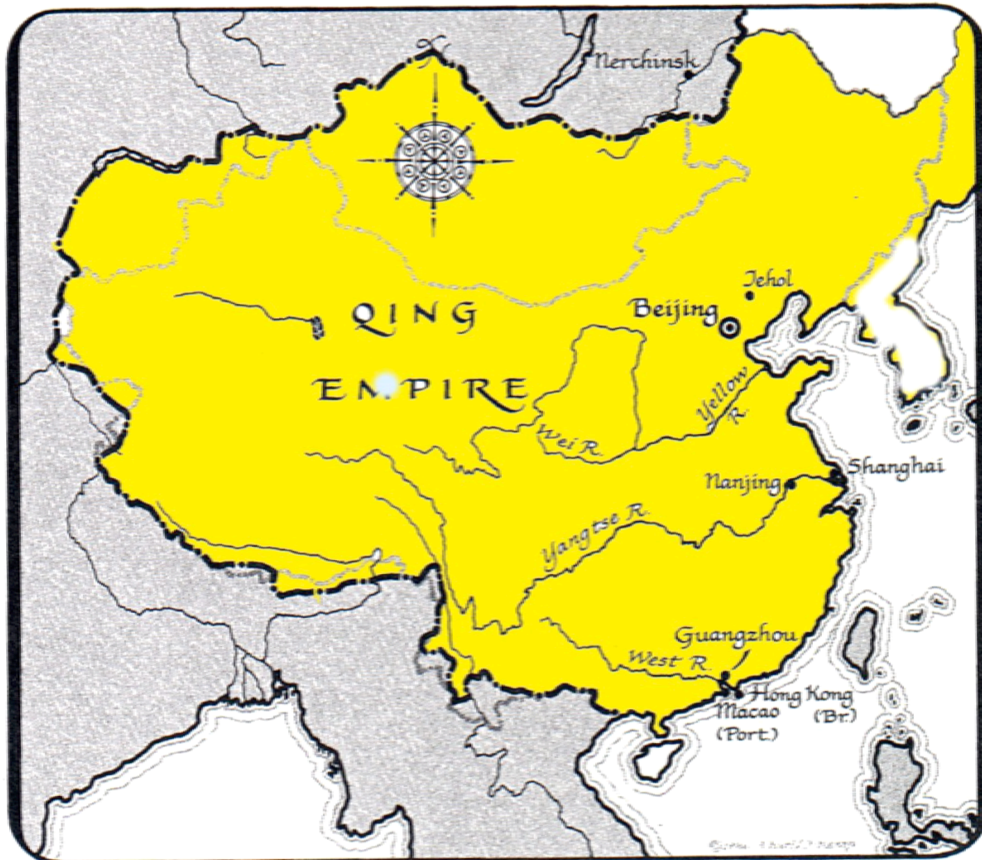
Qing Dynasty Empire (1644-1911)