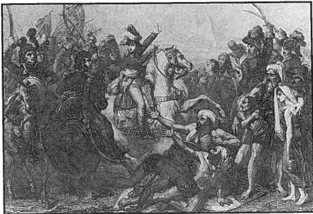
«Konfrontasjonen med det moderne vesten, frå Napoleon Bonapartes soldatar steig i land ved Alexandria i 1798 og til i dag, har skapt si eiga mytiske verd full av heltar, skurkar, sigrar og nederlag, mest det siste.»

for korleis folk frå desse stadene tenker og handlar. Likevel er desse lokale historiene bitar av same storforteljing , enten denne storforteljinga er Norgeshistoria eller det vi tradisjonelt har lært på skulen som «verds-historie», dvs. Vest-Europas historie. I forholdet mellom arabarverda og Europa er det snakk om at sjølve storforteljinga er ulik. For folk i Midtausten har historia som ramme for tenking, som reservoar for meningsberande referansar opp gjennom tidene, vore ei anna enn vår. Ein har hatt eit anna mytisk landskap å plassera seg sjølv og motstandarane i, eit anna vokabular for å beteikna godt og vondt, retteferd og undertrykking. Her er det ingen bjeller som ringer ved ord som demokrati eller republikk , eller ved årstal som 1789 eller 1814, men det gir umiddelbar gjenklang når ein døyper politiske rørsler muwahhidin eller mujahidin , når ein krev Sharia og shura innført i statsaker, eller appellerer til heltemotet frå Qadisiyya eller Ayn Jalut. 8