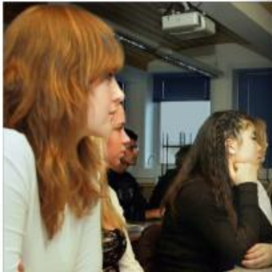
VÅKNT Forenet er en viktig del av vannets indre liv. (Foto: Ove R. Skjold)

Viktig for alle I et stort tema som er behandlet i denne boka. (Foto: Ove R. Skjold)