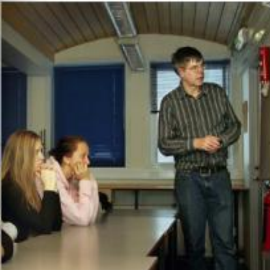
STILT Forenet er en viktig del av vannets indre liv. (Foto: Ove R. Skjold)

– Dette boka er et stort tema som er behandlet i denne boka. (Foto: Ove R. Skjold)