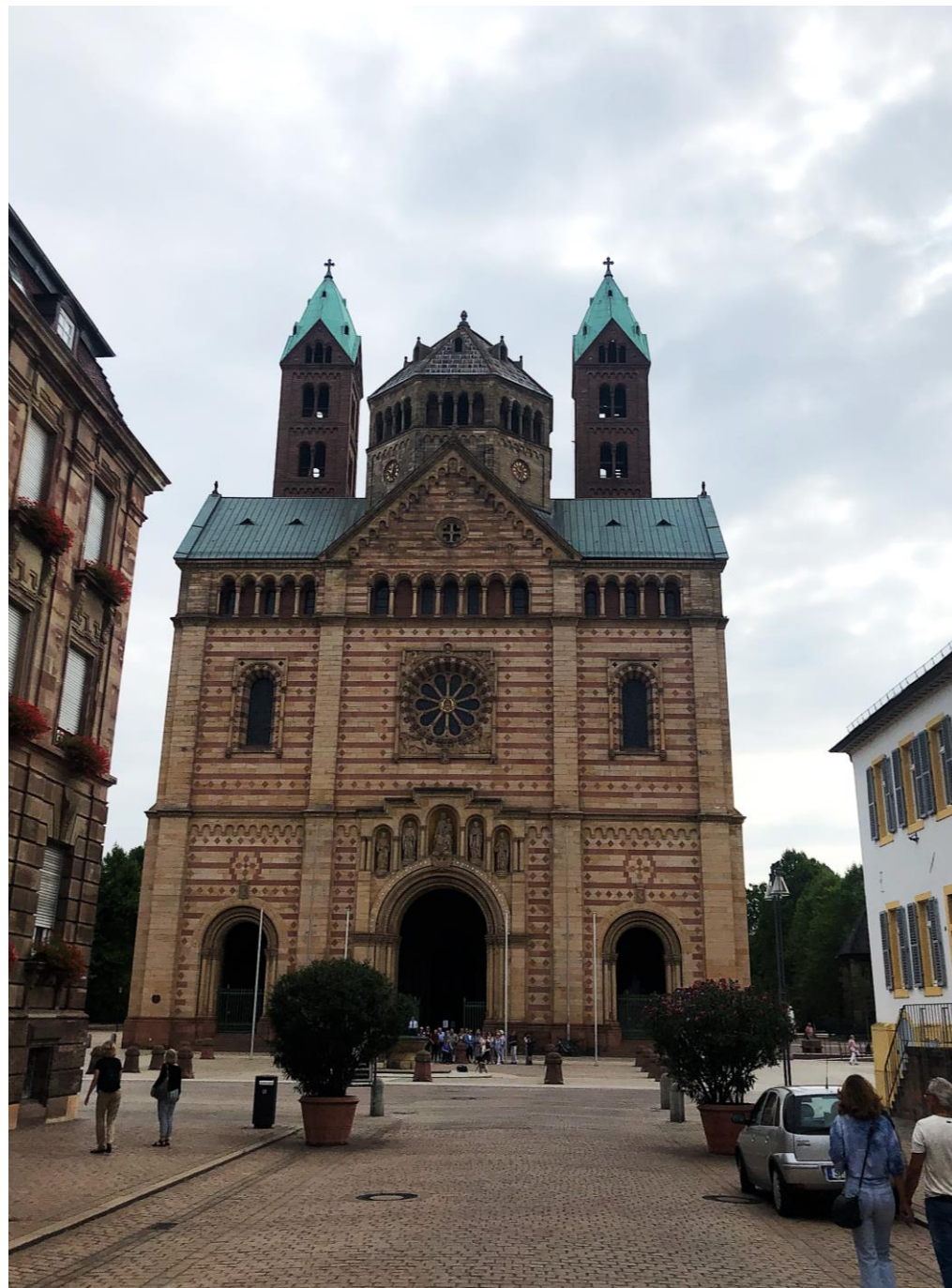
Speyer, Rheinland-Pfalz, Tyskland