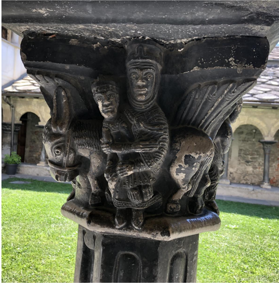
Aosta, Aostadalen, Italia