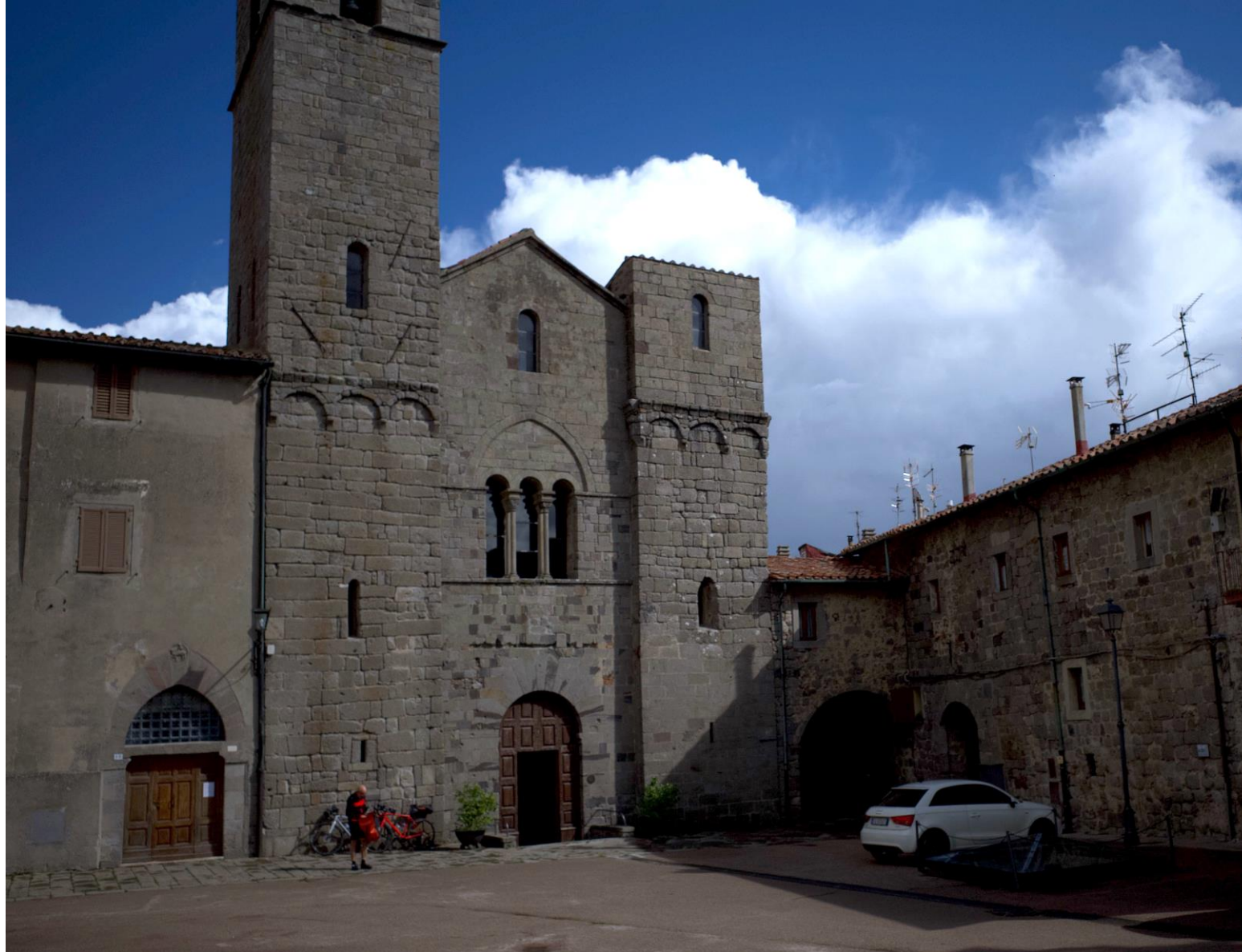
Abbadia San Salvatore, Toscana