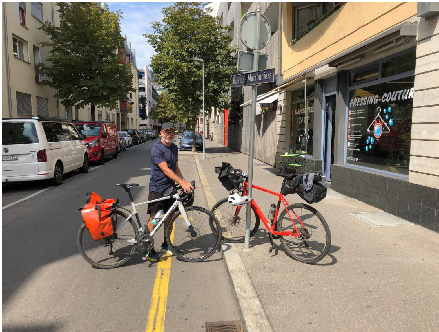
Vevey, Vaud, Sveits