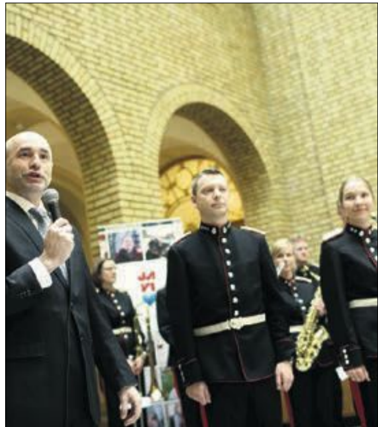
JUBILEUM: Stortingets president Dag Terje Andersen var begeistret da medlemmer av Forsvarets stabsmusikkorps framførte jubileumsmarsjen på Stortinget i går.