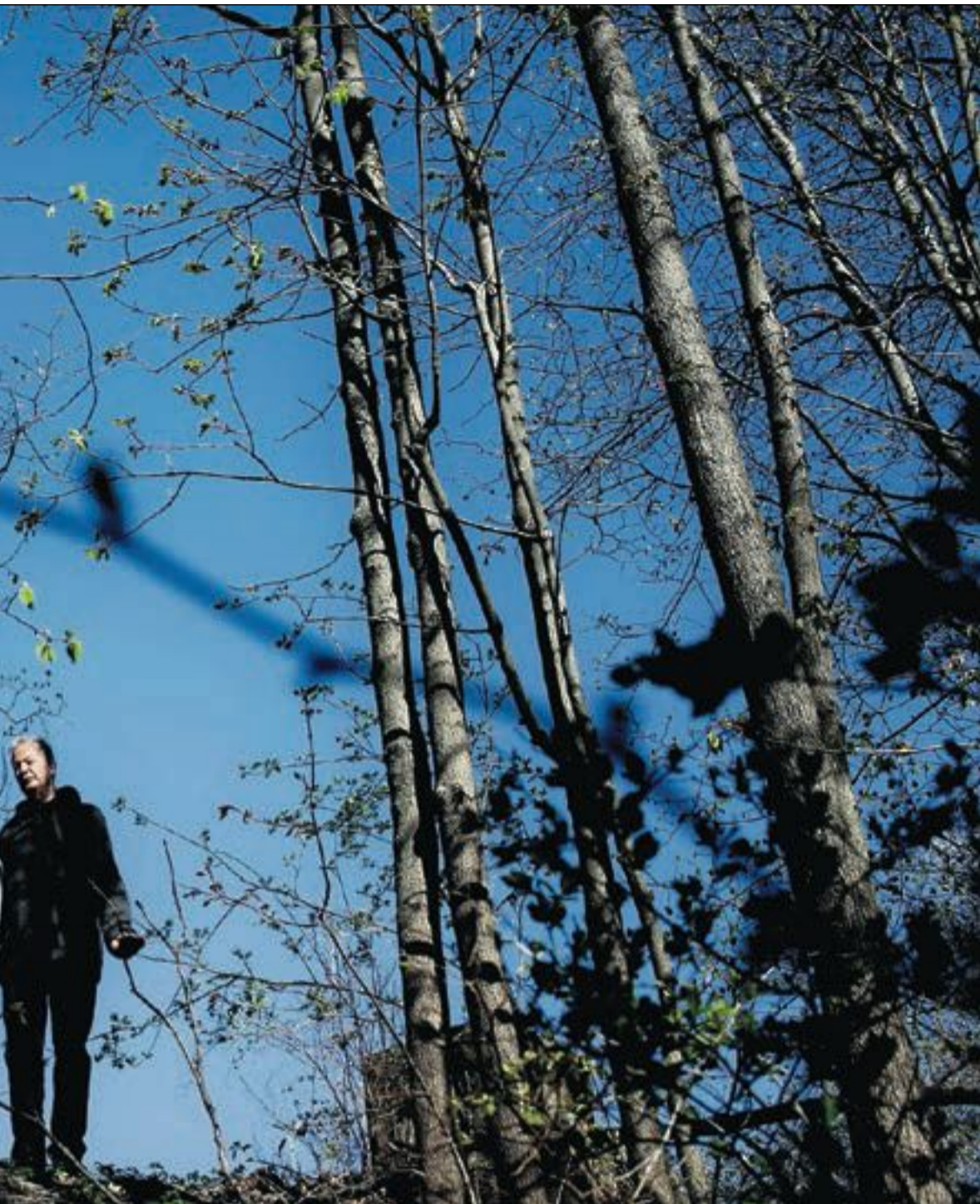
adører for Grunnloven når de holder 17. mai-taler.

1 og 2012. Noe endret seg etter 22. juli: