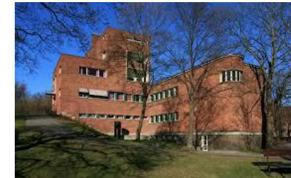
Utvendig rehab Svein Rosselands hus