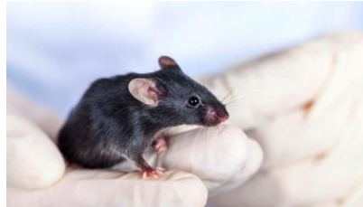
Dyreavdeling Domus Medica