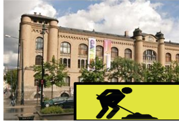
Historisk museum Klimaskjerm 2018-2020