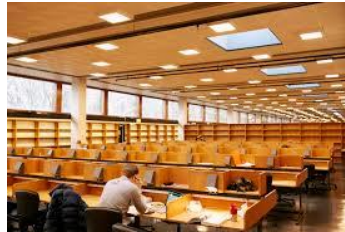
Modernisering av Læringscenteret Eilert Sundts hus (SVI)