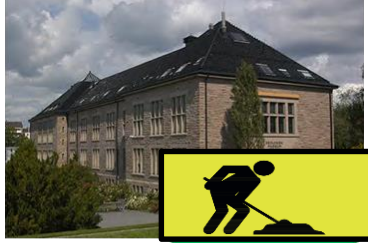
W.C. Brøgger hus Bygges 2015-2020