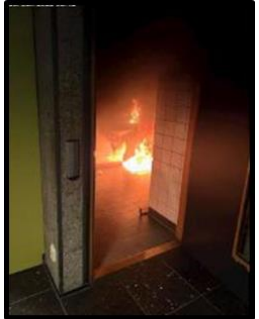
Brann i Vilhelm Bjerknes hus 2022.