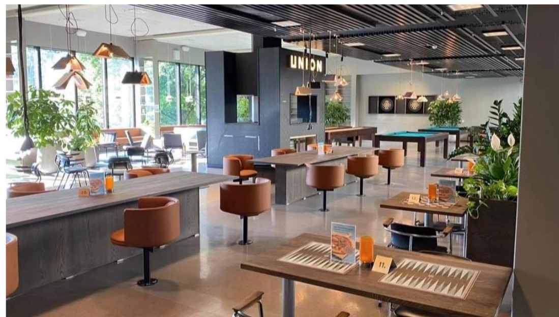
Vi sees på Union371 på Blindern

Tid og sted: 18. okt. 2023 16:30 – 18:30, Union371 Blindern