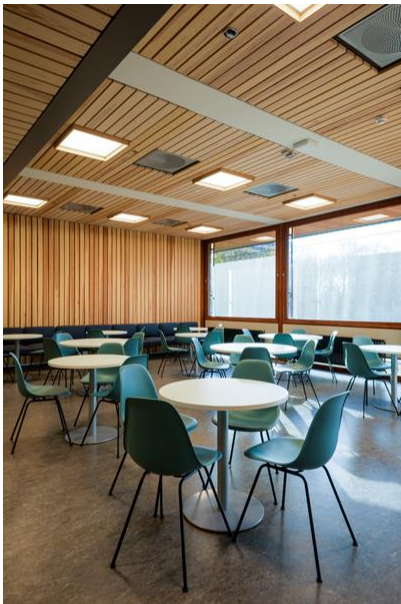
Fra romforflere.no Foto: Sebastian Dijkstra Nilander