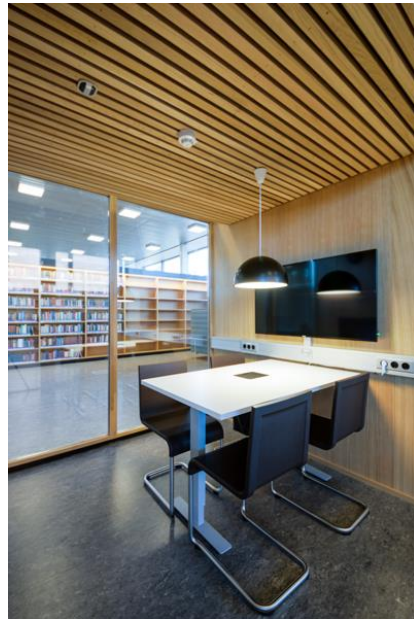
Fra romforflere.no Foto: Sebastian Dijkstra Nilander