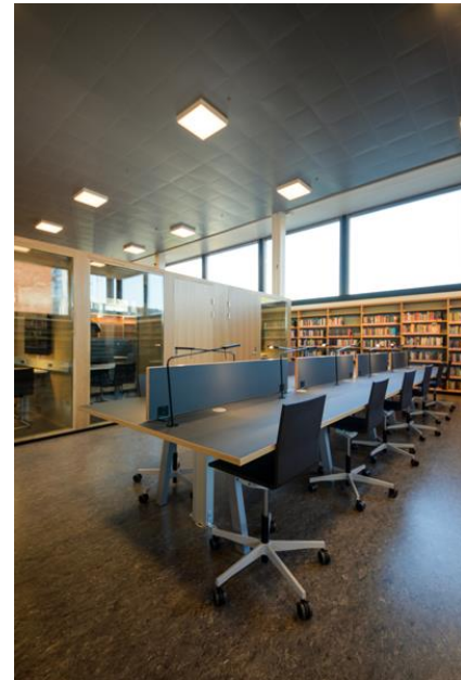
Fra romforflere.no Foto: Sebastian Dijkstra Nilander