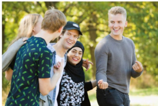
Ny rekord i antall søkere for UiO.

Universitetet i Oslo har i år en økning på 16 prosent søkere. Nasjonalt er økningen ni prosent. UiO har nå 3,41 søkere per studieplass og 21 062 søkere har UiO som sitt førstevalg. Nye, tverrfaglige studieprogram er svært populære.