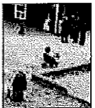
For alle aldre