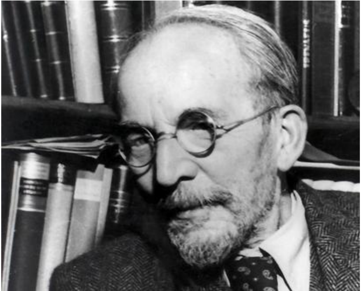
Friedrich Meinecke 1862-1954