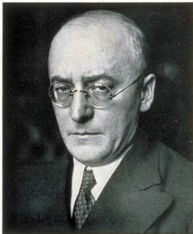
NEW GERMANY'S IRON CHANCELLOR

"After the Young Plan ... maybe Germany's dipout?" (See Feature News)