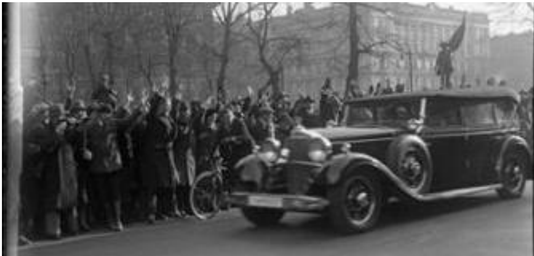
Hitler på vei til edsavleggelsen