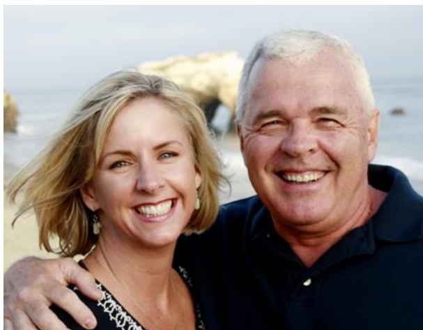
Babyboomers 1945-1964 (OD: 119)