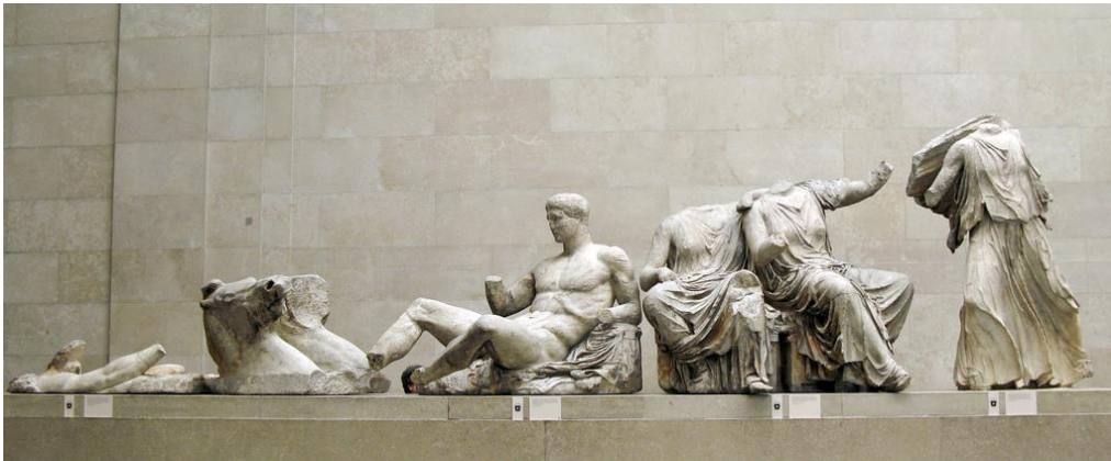
Helios og hans hester, Dionysos ( Herakles) 438-432 f.kr