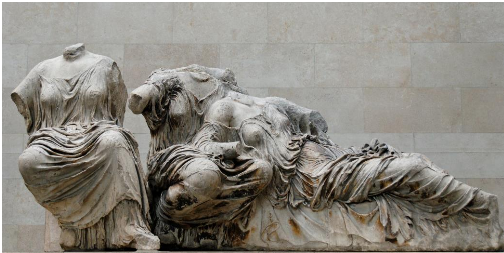
Tre guddinner 438-432 f.kr.