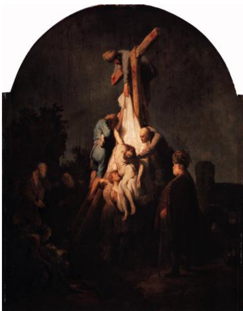
Rembrandt, Descent from the Cross , 1633.