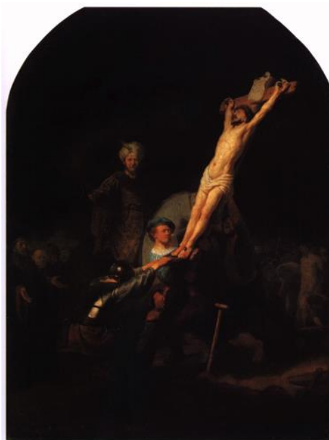
Rembrandt, The Raising the Cross , c.1633.