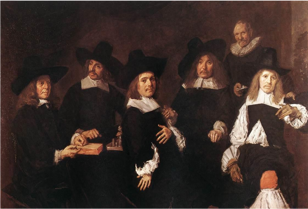
Frans Hals, Regents of the Old Men's Almshouse , 1664.