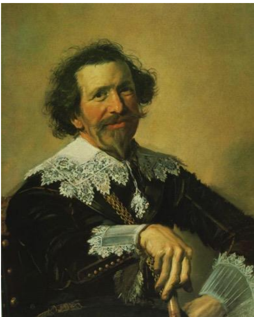
Frans Hals, Pieter van den Broecke , c. 1633.