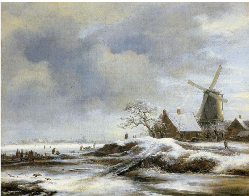
Ruisdael, Vinterlandskap med vindmølle , 1670.