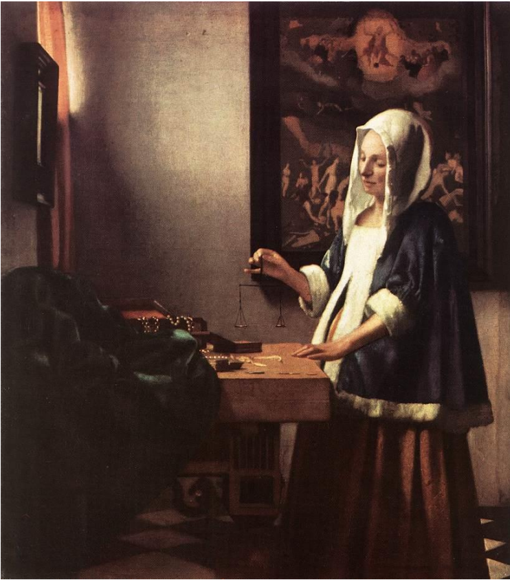
Jan Vermeer, Woman Holding a Balance , 1662-1663.