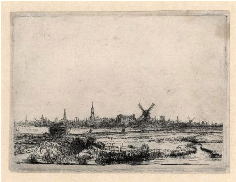
Rembrandt, View of Amsterdam , 1640, etsning.