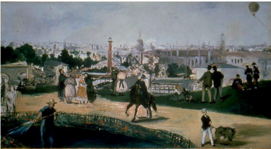
Manet, Verdensutstilling , 1867.