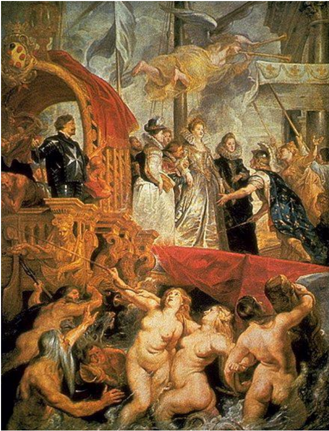
Rubens, Maria av Medicis ankomst i Marseille , 1622.