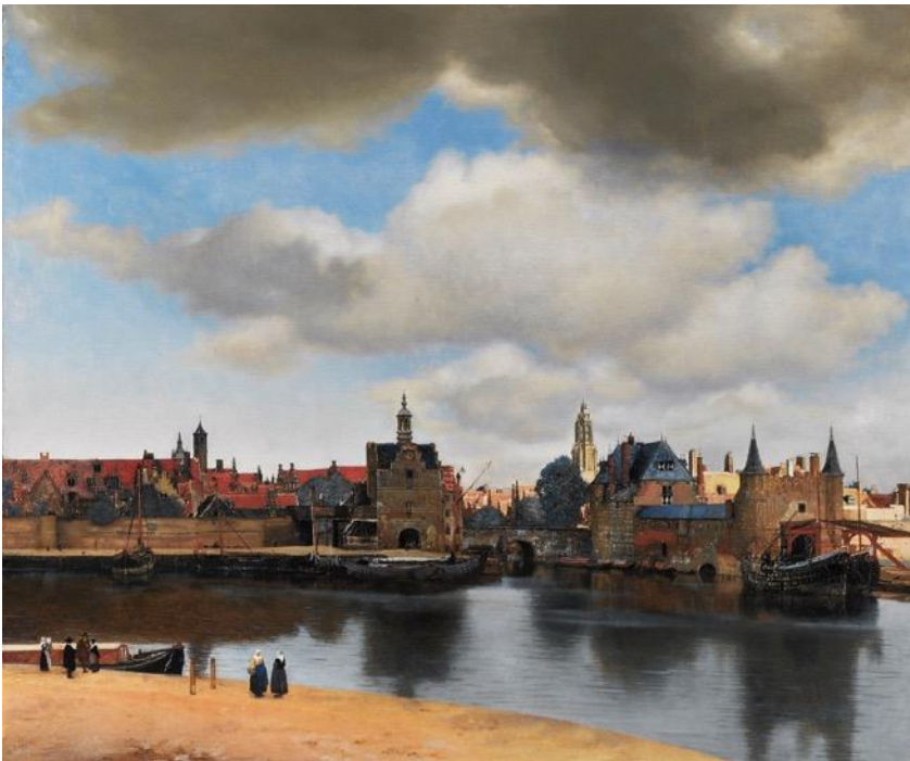
Vermeer, View of Delft , c.1662.