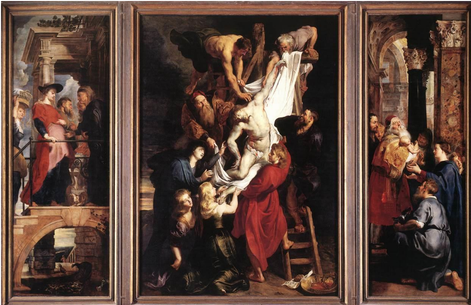
Rubens, Descent from the Cross , 1612-1614.