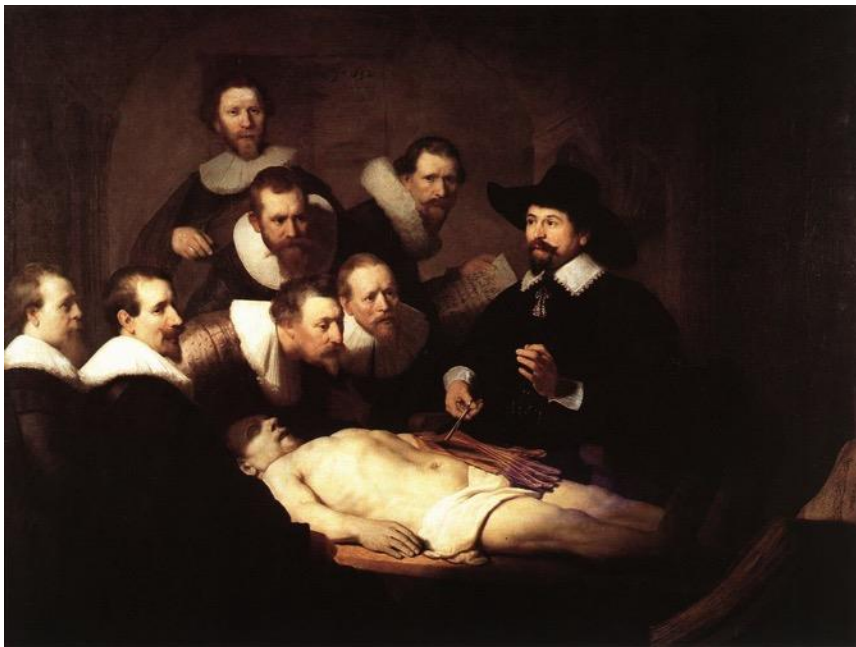
Rembrandt, The Anatomy Lecture of Dr. Nicolaes Tulp , 1632.