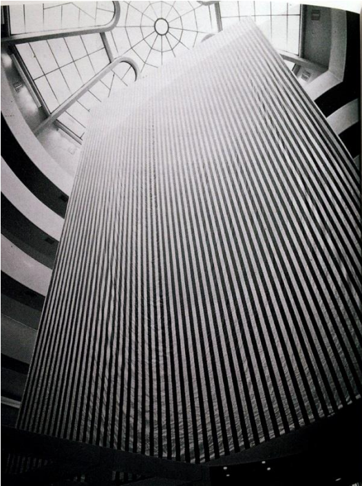
Daniel Buren, Peinture-Sculpture , 1971.