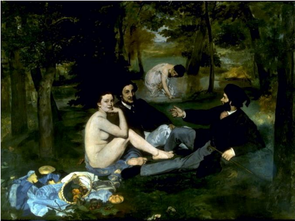
Manet, Frokost i det grønne , 1863.