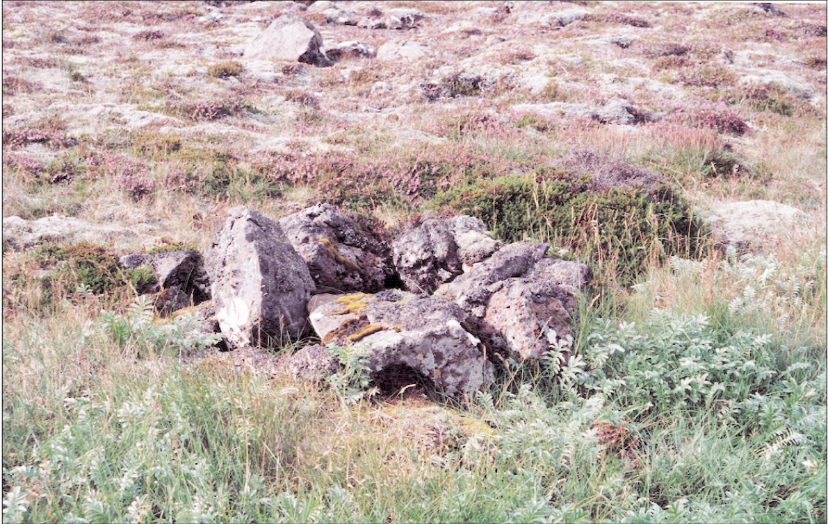
Mynd 18. Brunnur við Kirkjuvog / Well by Kirkjuvogur K-181033-35-2.