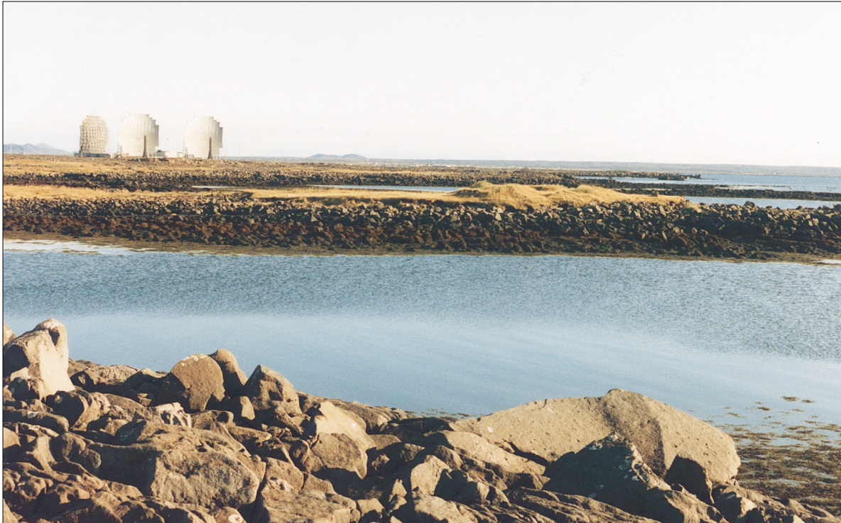
Mynd 2. Básendar. Bæjarhóllinn B-182395-40-5 er hægra megin við miðju á myndinni. Vör B-182395-40-1 sést í fjörunni neðan við hann til hægri. Ratsjárskermar í bakssýn. / Básendar. The farm stead is to the right. A narrow landing place is further to the right.

sameinar þess vegna hagsmuni fræðigreinarinnar og þeirra sem standa að framkvæmdum.