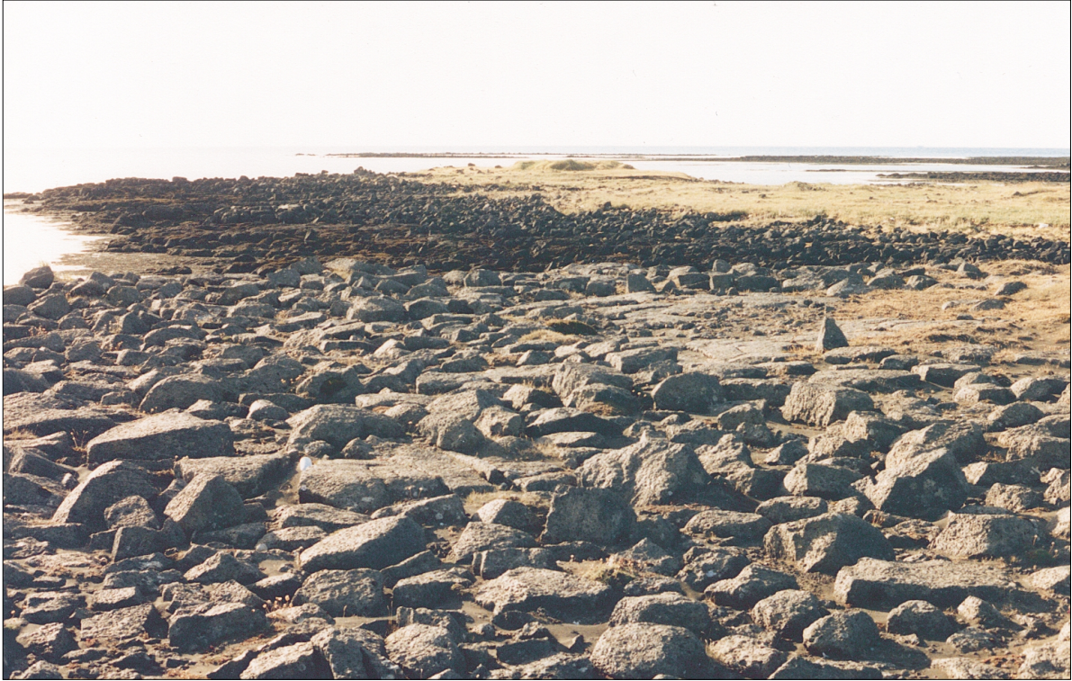
Mynd 1. Horft yfir Básendakaupstað. / Remains of Básendar trading station (GÓL).

ar ábendingar um landamerki og heimildir.