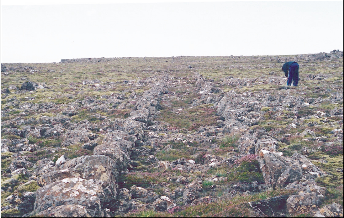
Mynd 13. Kaupstaðavegur / Township Trail B-182395-40-30.