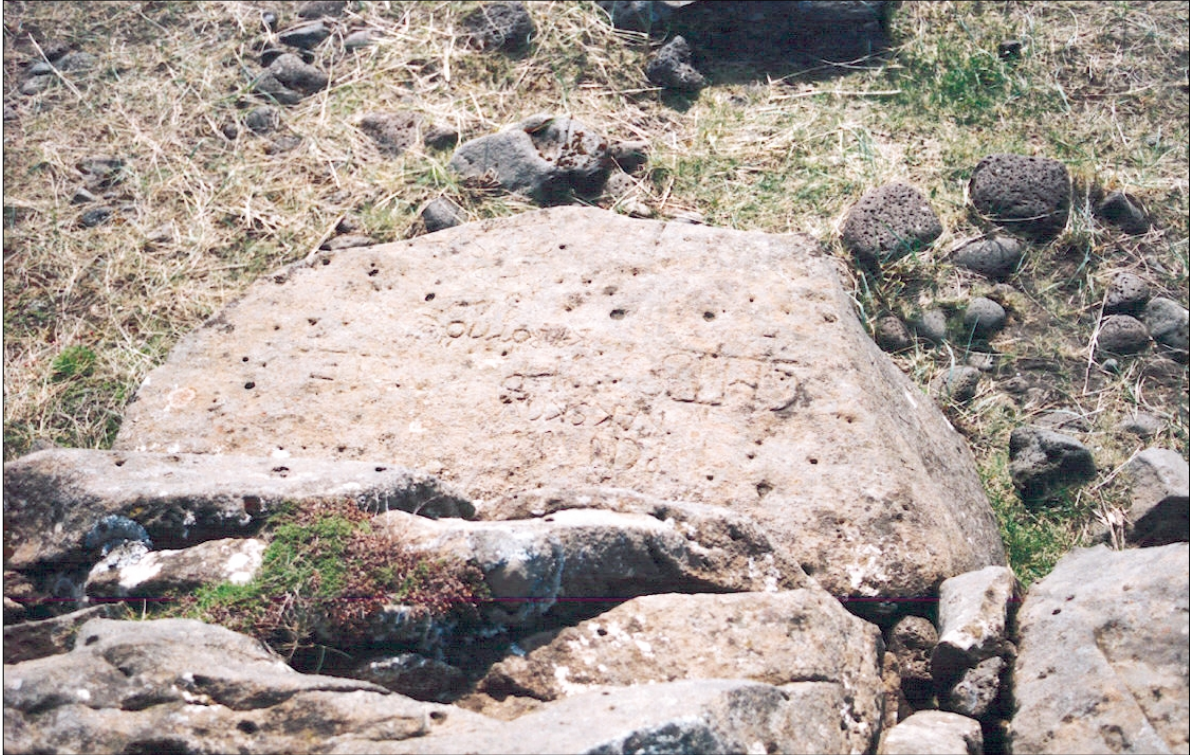
Mynd 6. Fangamörk við Þórshöfn / Inscriptions by Þórshöfn S-181039-40-5.