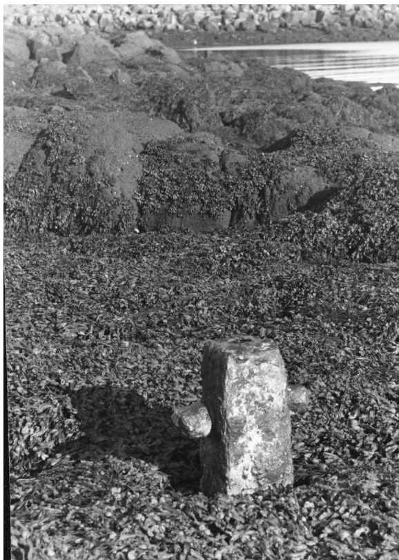
Mynd 10. Festarhringur á Básendum / Fastening Ring at Básendar B-182395-40-2.

Staðhættir og lýsing: Í þangi vaxinni klöpp, 42 m niður frá suðvesturhorni húsgrunnins mikla (vöruhúsið nr. B-182395-40-6), er járnkarl vel gildur en ryðbrunninn, greypur og tinsteyptur við klöppina. Hann er um 15 sm á þykkt og 30 sm á hæð með áföstu hringbroti í gati ofarlega. „Þetta var hestasteinninn á hlaðinu, fyrir stjórnborða-beizli sjóhesta. [Aðrir festarhringir fundust ekki sem áttu að vera utar og í klöppum við suðurhlið legunnar, sjá B-182395-40-3]. Þannig hafa skipin verið „svínbundin“ á báðar hliðar og frá báðum stöfnum.“ Svo segir í Blöndu, en Magnús Grímsson segir þau skip „svínbundin“ sem bundin séu landfestum „svo að ei máttu snúast fyrir vindi.“