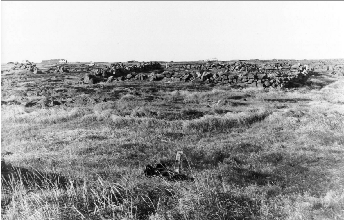
Mynd 12. Rétt og útihús á Básendum / Corral and animal sheds at Básendar B-182395-40-18/19.

árla morguns 9. janúar 1799 þegar sjórinn var að mola undan þeim íbúðarhúsið (B-182395-40-8) í Básendaflóðinu: „Eg vóð með yngsta barnið á handleggnum, þar sem sjórinn flæddi yfir og skolaði með sér borðum, plönkum, fjármunum og búshlutum. Náðum þó fjósinu með mestu erfiðismunum og lífshættu. Fjósið stendur svólitið hærra og fjær sjónum en íbúðarhúsið. En tæplega höfðum við dvalið þar fjórðung stundar, þegar mæniásinn brast í fjósinu. Við urðum því að flýja þaðan aptur.“