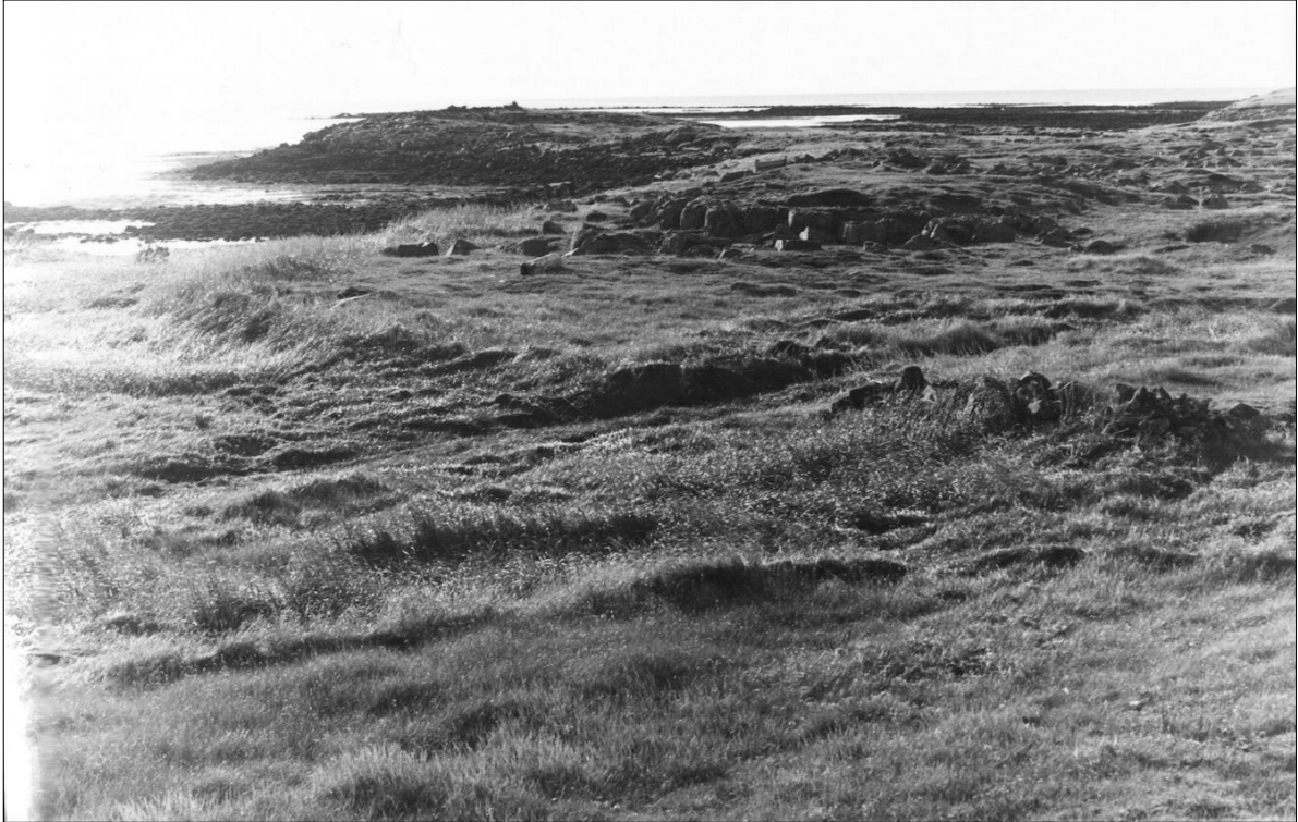
Mynd 8. Básendar / Básendar. (PM)