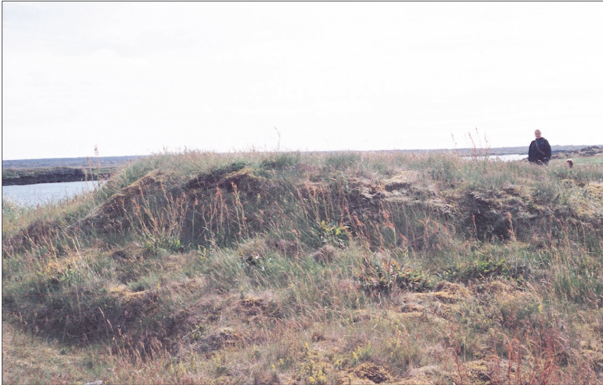
Mynd 17. Bæjarhöllinn á Kirkjuvogi / Farm hillock in Kirkjuvogur K-181033-35-1.

Íslenskir annálar sive Annales Islandicum ab anno christi 803 ad annum 1430, 1847. Bls. 236, 238.