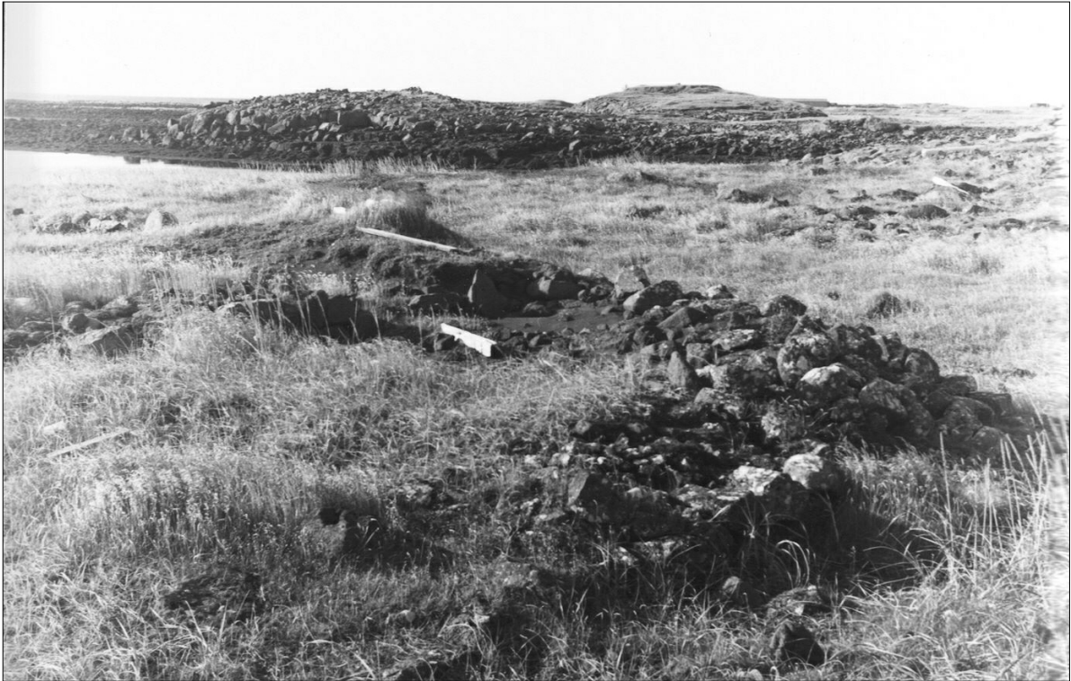
Mynd 11. Tóftir á Básendum / Ruins at Básendar B-182395-40-10/11/12.

mannvirkja (sjá nr. B-182395-40-10 til B-182395-40-12 auk B-182395-40-14) sem ekki er vitað hvaða tilgang höfðu, svo illa voru þau farin. Meðal þeirra kunna fátæklegar leifar lýsibúðarinnar að vera, þó tæplega B-182395-40-14 því að þar virðist vera meira varðveitt en lýsing af lýsibúðinni gefur til kynna. Um þetta verður þó ekkert fullyrt.