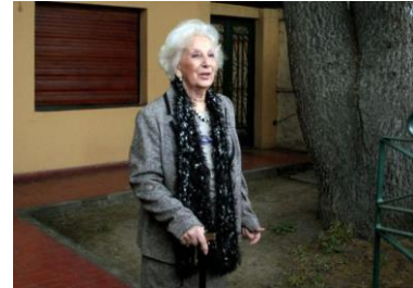
Estela de Carlotto atiende a la prensa a las puertas de su casa en La Plata.

No hubo fotos, ni periodistas. Pero Estela de Carlotto pudo por fin abrazar al nieto al que había buscado durante 36 años, por el que dio la vuelta al mundo, se convirtió en la presidenta de las Abuelas de Plaza de Mayo, y por el que ayudó a recuperar la identidad biológica de otros 113 bebés robados durante la dictadura.