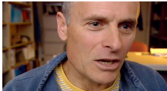
Up close and personal.