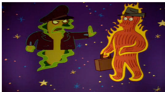
An Inconvenient Truth

Visuelt: Når argumentene til tilhengerne av teorien om menneskeskapt global oppvarming vises, projiseres de gjennom bruk av barnslige animasjoner utformet ved hjelp av gammel animasjonsmetoder som var moderne en gang på 60-,70-tallet. Dette fremstiller til tider miljøbevegelsens argumenter som gammeldage og barnslige. Dette er et vink til Al Gores film, som har fått mye ros for sin lettfattelige fremstilling av hvordan varme fra solen holdes igjen av drivhusgasser, forklart ved animasjonene til Simpsons-skaper Matt Groening. På samme måte som i filmen til Gore, fremstilles argumentene videre gjennom grafer og avansert bruk av visuell utforming. Dette gir inntrykk av at disse argumentene stammer fra moderne vitenskapelige metoder som er oppdaterte og ikke gammel teori fra et tilbakelagt stadiet i forskningen. Man bruker også grafer hentet rett fra An Inconvenient Truth som kombinert med nye grafer og funn, som angivelig beviser at det allmenne konsensus er feil.