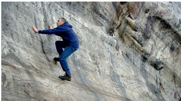
En forsker i sitt rette element.