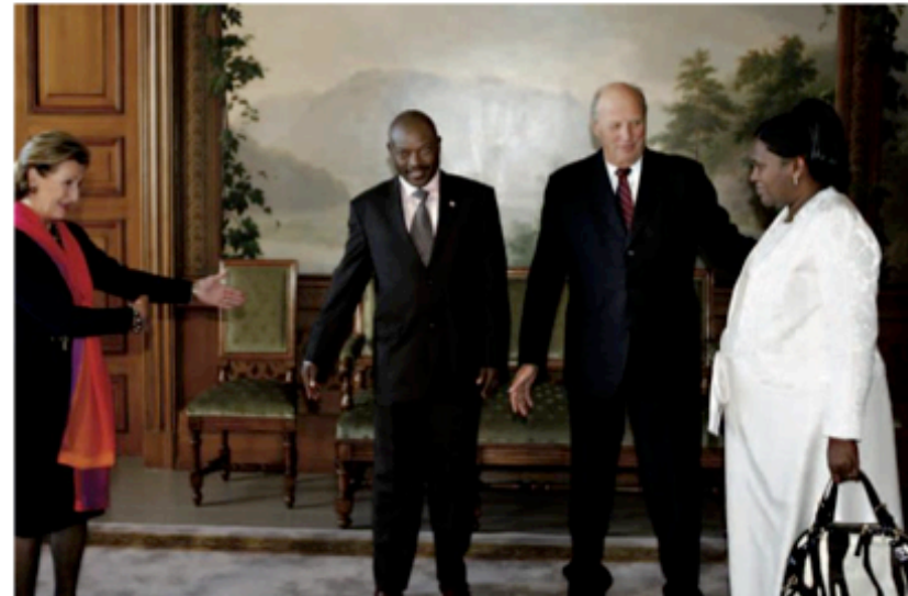
PÅ NORGESBESØK: I går tok kong Ntare og dronning Soga Inot Burundis president Pierre Nkurunziza og hans fru, i audiens på slottet.