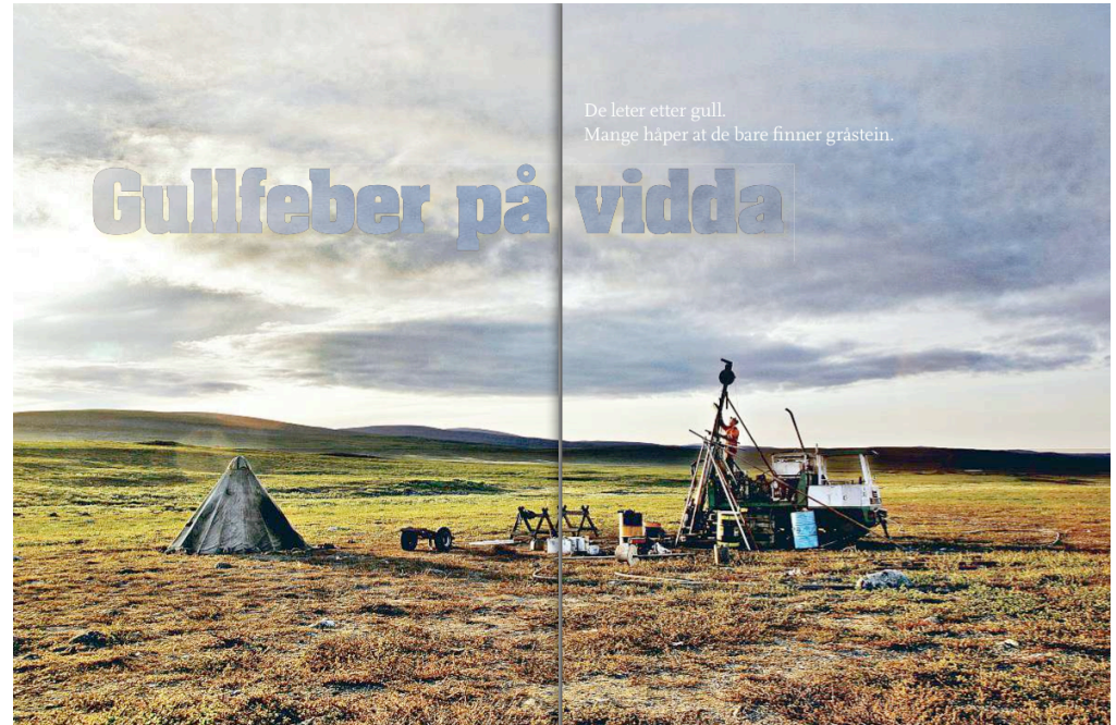
De leter etter gull. Mange håper at de bare finner gråstein.