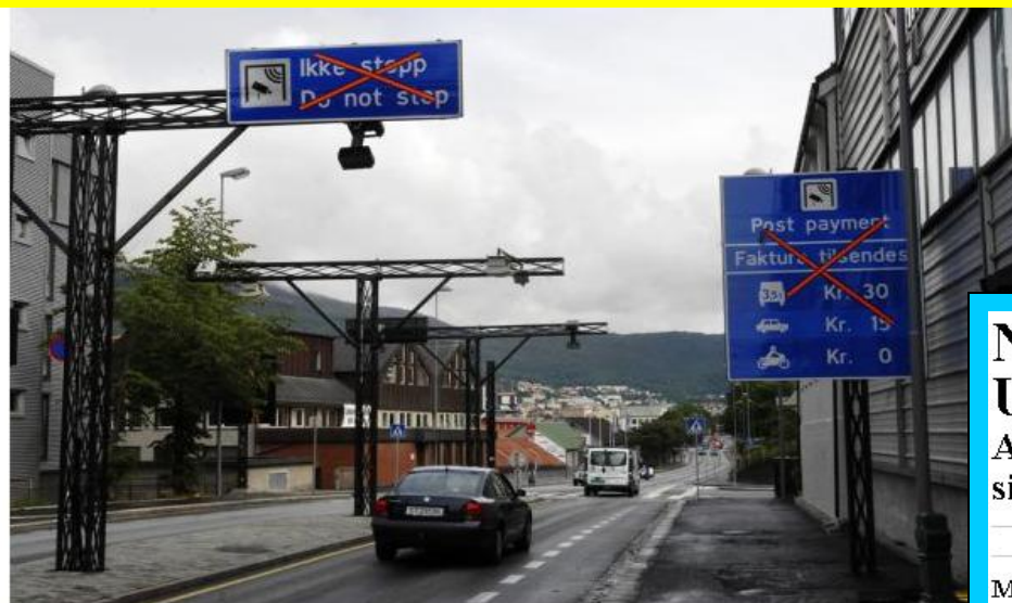
UTFORDRING: Personvernkommisjonen mener det bør være mulig å passere bomringer uten at det registreres hvem som passerer.