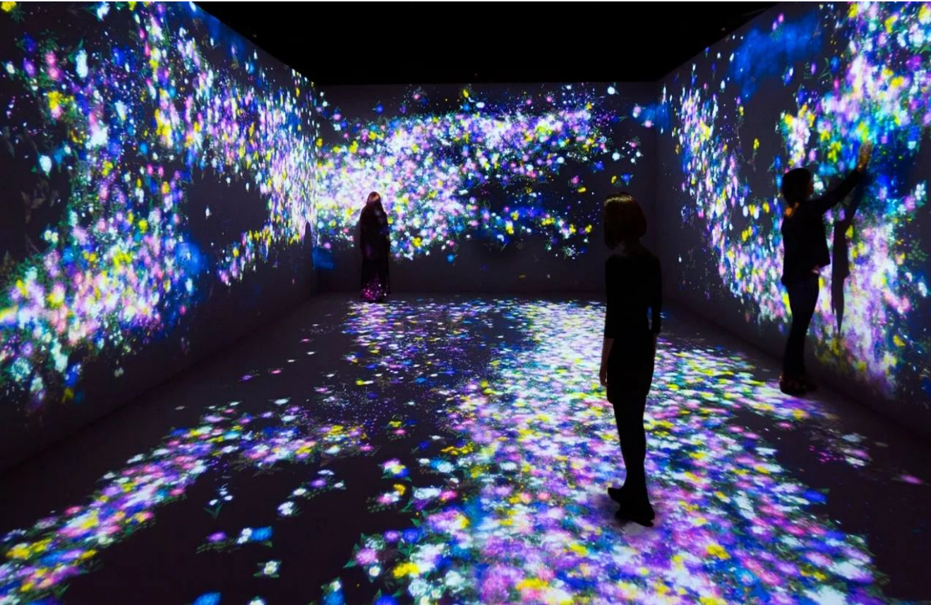
Inspirasjon til endelig produkt