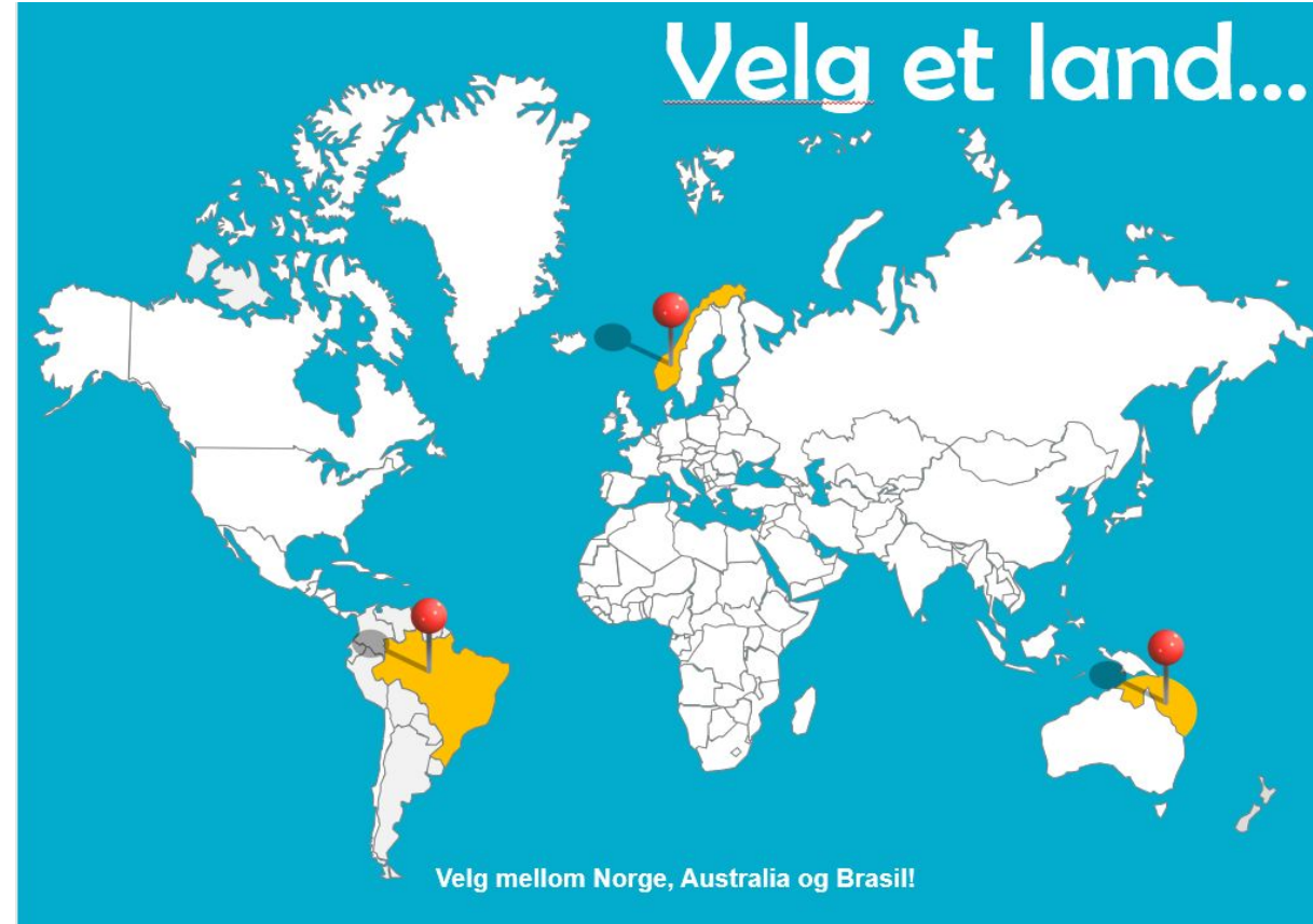
Prototypen til Climate Your Way - hvor man kan velge selv hvilket land man vil dra til