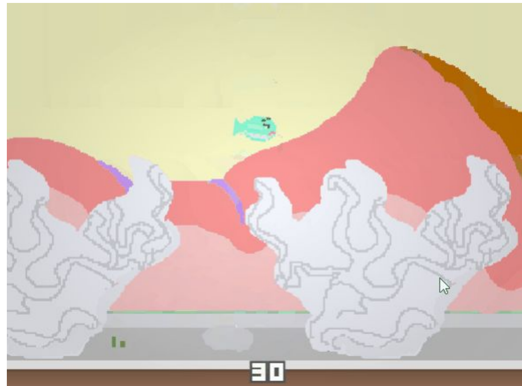
Minispillet "Clappy Fish"

Tropiske koraller blir mindre og mindre på grunn av global oppvarming, forurensning og turister.