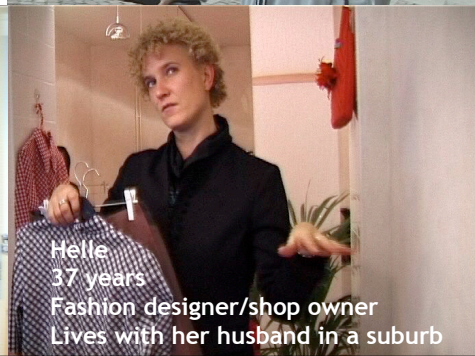
Helle 37 years Fashion designer/shop owner Lives with her husband in a suburb