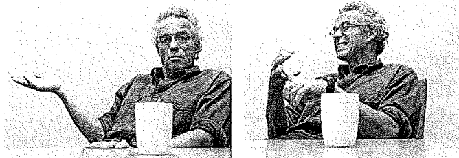
- Vi sier ikke tvært nei til kunstgjædel, men vi vil ha mer økologisk landbruk.