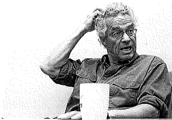
- Jeg er enig i at vårt program ikke er uten overbud.