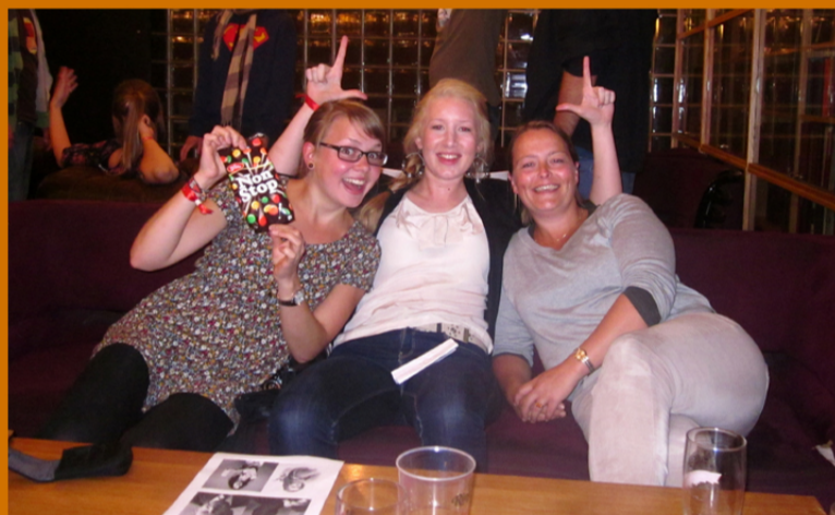
Fadderuker, hyttetur, quiz & vaffeltreff.